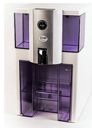
Installée en 5 minutes La compacité en prime !

Filtre à sédiments + Filtre charbon actif + Membrane osmose inverse. Filtration à 0,0001 µm : ne laisse quasiment passer que l'eau et quelques minéraux (minéralité résiduelle < 10-30 mg / L.) Meilleure filtration pour chlore & ozone, nitrates/nitrites, sulfates, bactéries, virus, métaux lourds, résidus médicaments & pesticides, minéraux inorganiques, etc. Une eau à tendance plus acide (protons H + ) et anti-oxydante (électrons), selon les paramètres énergétiques de la Bioélectronique de Vincent (BEV), référence des experts de l'eau.