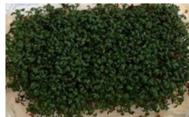
Cresson sain 12 jours sans Wi-Fi