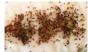
Cresson malade 12 jours avec Wi-Fi